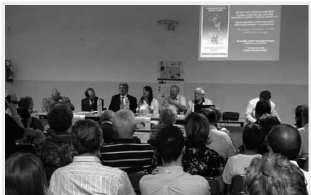
Fig. 2 - Sicignano degli Alburni (SA). 6 agosto 2016. Convegno Tempora Medievalia al Castello Giusso del Galdo.