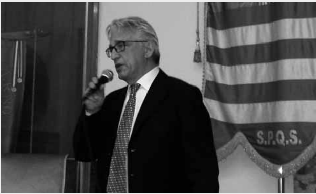
Fig. 5 - Salerno. 29 gennaio 2016. Longobard ways . Il sindaco Enzo Napoli.