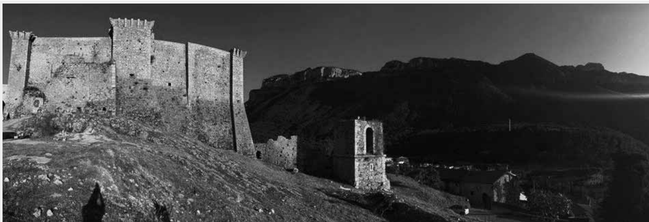
Fig. 3 - Sicignano degli Alburni (SA). Il Castello Giusso del Galdo.

Finalità dell' Itinerario è produrre una valorizzazione sistematica dei Beni Culturali, una promozione dei prodotti tipici del territorio e un conseguenziale sviluppo dell'imprenditoria, soprattutto giovanile.