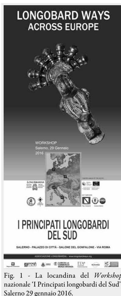
Fig. 1 - La locandina del Workshop nazionale ‘ I Principati longobardi del Sud ’, Salerno 29 gennaio 2016.

Il miglior strumento di conoscenza, di approfondimento personale e collettivo individuato dal Consiglio d’Europa e promosso dall’Istituto è quello del ‘Viaggio’, inteso come percorso fisico ed intellettuale che favorisce la libera circolazione delle idee e consente di porre le singole persone davanti alla arricchente possibilità di conoscere culture e tradizioni di altri Popoli europei e di individuare radici comuni che hanno influenzato le vicende storiche di più Paesi e sulle cui basi ricercare nuovi punti di intesa per