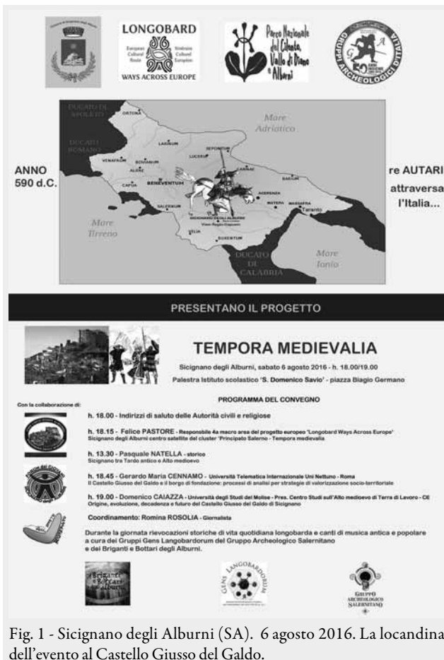
Fig. 1 - Sicignano degli Alburni (SA). 6 agosto 2016. La locandina dell'evento al Castello Giusso del Galdo.

Un progetto che racconta il viaggio dei Longobardi in Europa, arrivati poi in Italia a fondare un Regno del Nord e diversi Principati del Sud. Un fil-rouge che unisce cronologicamente, dal I sec. al 1077, i popoli europei.